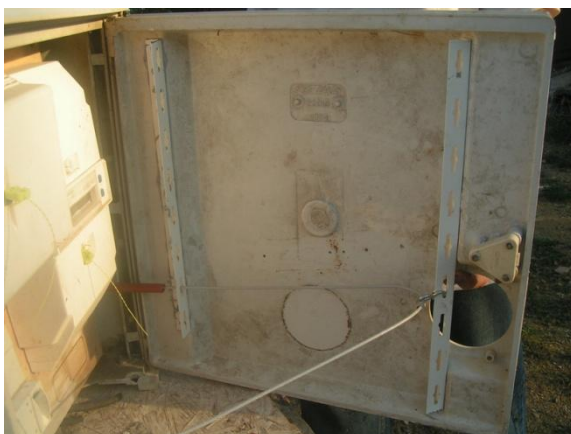
Le crochet et les boulons

Le câble de 4 mm qui sort du guide côté charnière, passe directement dans un trou du rail. Puis ce câble va vers l'autre rail. Mais il ne s'accroche pas directement au rail (côté serrure). Là, par l'intermédiaire d'un crochet, il s'accroche dans le rail, et repart dans l'autre guide côté serrure.